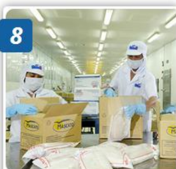
8 BAO GÓI - ĐÓNG THÙNG