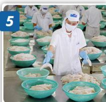
5 PHÂN MÀU, PHÂN LOẠI