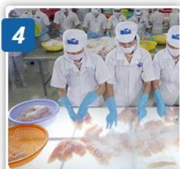
4 KIỂM TRA SINH TRÙNG