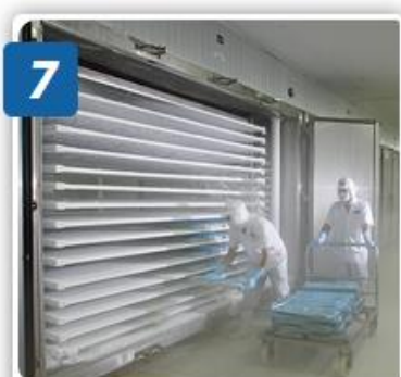
7 CHỜ ĐÔNG - CẤP ĐÔNG