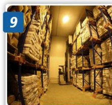
9 BẢO QUẢN