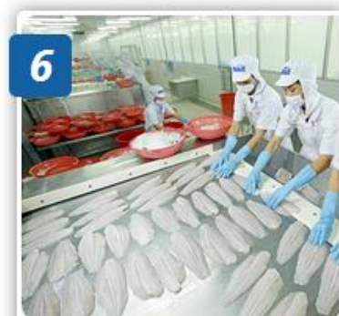
6 CHẠY BĂNG CHUYỀN