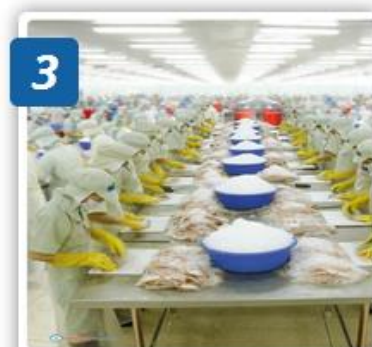
3 ĐỊNH HÌNH