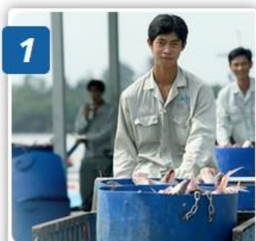
1 TIẾP NHẬN NGUYÊN LIỆU